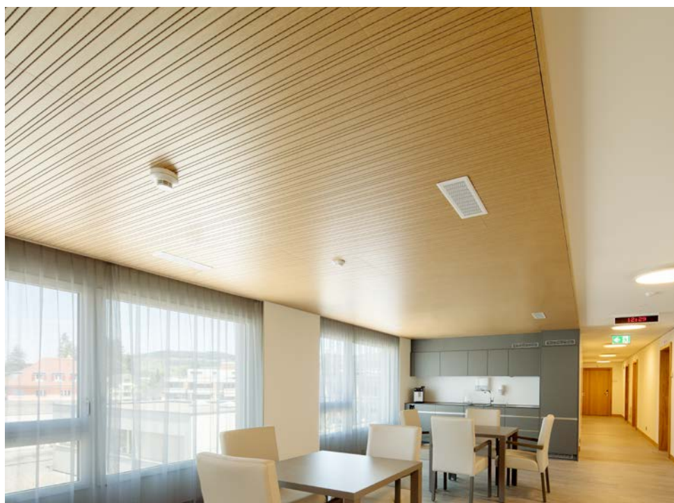
Bernstrasse, Thun .